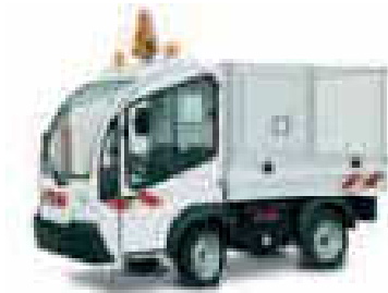
Περιμετρικό kitΕξωτερική πρίζα P17 ανακλαστικών ταινιών