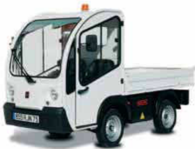
Pick-υρμε σταθερή πλατφόρμα