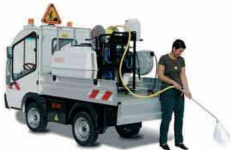
Με Σύστημα άρδευσης