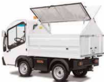
Απορριματοφόρο με πλευρικό άνοιγμα τύπου γλάρος