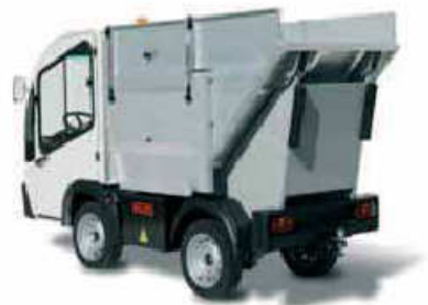
Απορριματοφόρο με ανατροπή