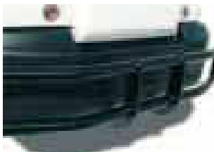
Προστατευτικές μπάρες μπροστά