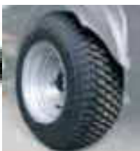
Ειδικά ελαστικά χαμηλής πίεσης για χλοοτάπητες