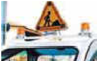
Led φωτιζόμενο τρίγωνο «Έργα σε εξέλιξη»πίσω φανώνμε πρίζα