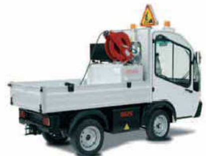
Για καθαρισμούς με νερό υψηλής πίεσης