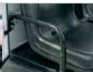
για οχήματα χωρίς πόρτες