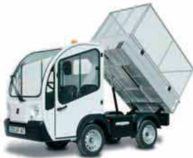
Ανατρεπόμενο με προστατευτικό