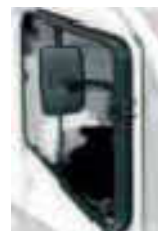
Μεγαλύτερα σε βάθος παράθυρα